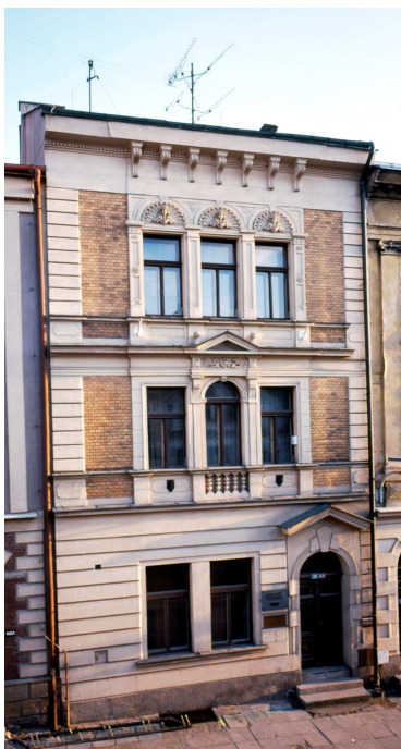
Budova v Tomkově ulici č.p. 620, sídlo hudebního oddělení

Hudební oddělení mělo 1.162 uživatelů (o 186 méně než v roce 2006), kteří si zde vypůjčili k prezenčnímu využití či absenčně 70.710 knih, časopisů, hudebnin, klasických gramodesek, CD, kazet a CD-ROMů. Počet i skladba výpůjček jsou téměř stejné jako v předchozím roce. Návštěvnost je však proti stejnému období nižší o 6.171 (celkem bylo zaregistrováno 17.656 návštěvníků). Do značné míry je to důsledek devítiměsíčního moratoria na půjčování nových titulů zvukových dokumentů v knihovnách, které si vyhradily ochranné autorské organizace; svůj podíl na poklesu má i skutečnost, že půjčovna hudebního oddělení nemá z nedostatku prostor téměř žádný volný výběr.