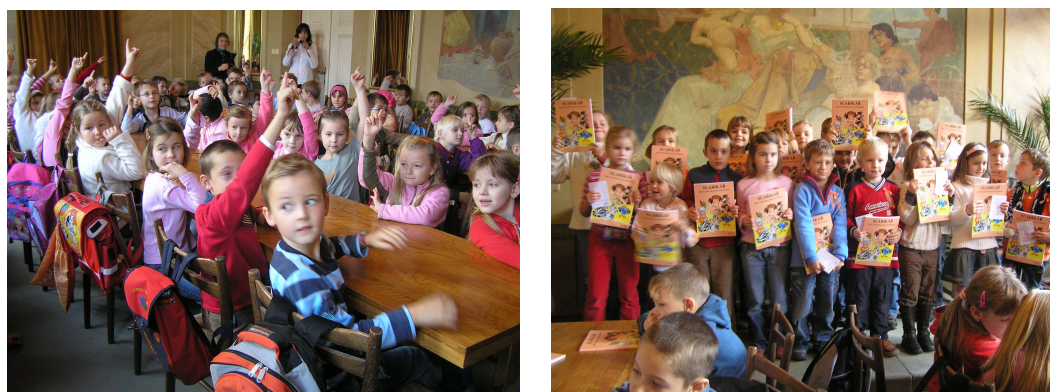
Prvníáčci ze ZŠ Štefánikova v přednáškovém sále při slavnostním předávání slabikářů

Poprvé jsme uspořádali slavnostní předávání slabikářů 76 žákům prvních tříd ZŠ Štefánikova: spolu se slabikáři a stužkami Malý čtenář obdržely děti zdarma čtenářské průkazy do knihovny. K novému druhu akcí pro děti patřilo letos Věnečkování (vázání adventních věnců v pobočkách Nový Hradec Králové, Malšovice a Březhrad) a experimentální cyklus věnovaný prožitkovému čtení v dětské knihovně Kalíšek.