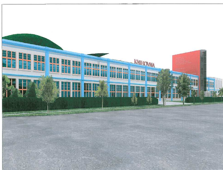
MĚSTSKÁ KNIHOVNA - HRADEC KRÁLOVÉ - DAVID VÁVRA - ULIČNÍ POHLED - LISTOPAD 2006

V roce 2007 byla dokončena projektová dokumentace pro územní řízení k rekonstrukci objektu Vertex na městskou knihovnu.