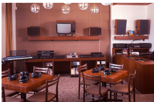
Poslechové studio hudebního oddělení

Poslechové studio navštívilo 984 klientů (proti předchozímu roku o 184 méně), z toho 250 individuálně a 734 v kolektivech. Při jejich návštěvách bylo využito 2.301 audiovizuálních dokumentů (o 322 víc než v roce 2006). Individuální poslech stále klesá, protože pro uživatele jsou výhodnější podmínky pro absenční půjčování, tj. výpůjčky domů (od roku 2005 bezplatně). Pro kolektivy jsme uspořádali 49 hudebně vzdělávacích pořadů (většinou zaměřených na děti a mládež), z toho 12 externě (většinou pro nevidomé).