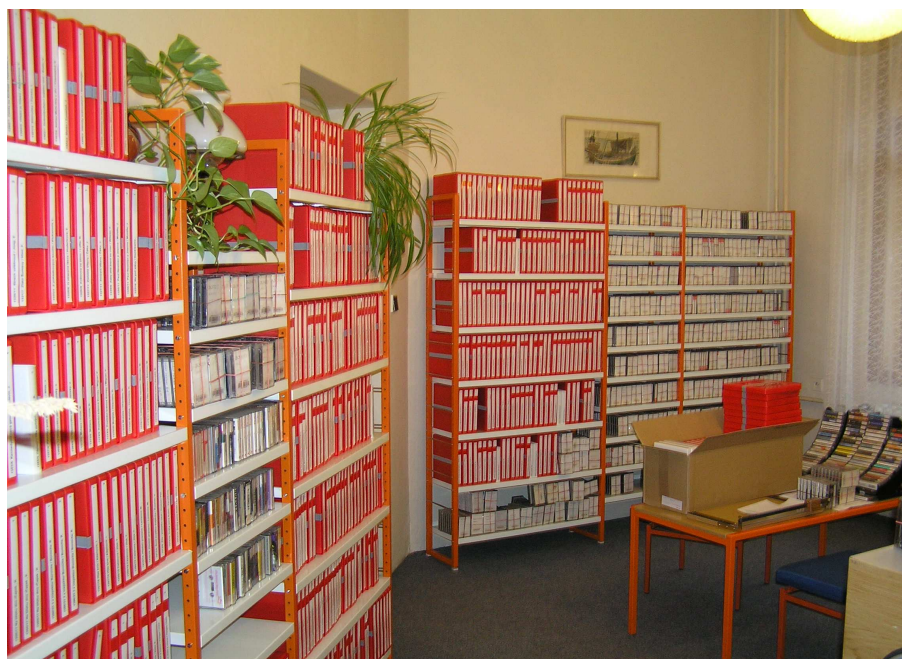
Prostory zvukové knihovny pro nevidomé v Tomkově ulici, p. 177

Pro Sjednocenou organizaci nevidomých a slabozrakých jsme uspořádali přednášku o nových nosičích zvukových knih a jejich praktickém užívání.