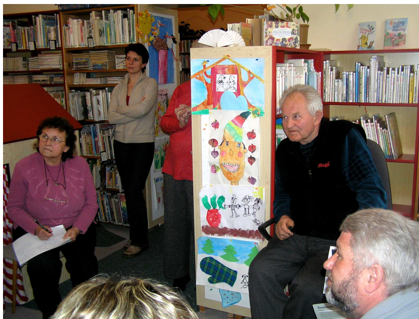
Dobrovolní knihovníci ze základních knihoven okresu Hradec Králové na 7. ročníku burzy internetových zkušeností.

Vzdělávání knihovníků jsme zajišťovali různými formami: uspořádali jsme 7. ročník burzy internetových zkušeností (20.3.), 3. ročník soutěže o nejlepší internetovou stránku knihovny Web sem, web tam , komponované pořady To byl Jiří Šlitr (15.5.), Vánoce na krku a Vánoce jinak (4.12.), turisticko-literární putování Expedice Oreb (6.10.).