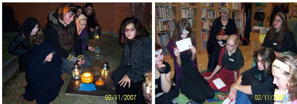
Malé i velké čarodějnice se zúčastnily Magické noci v kuklenské knihovně

Tradiční akce pro dětské čtenáře Noci s Andersenem a Magická noc proběhly v půjčovnách pro děti na Novém Hradci Králové a v Kuklenách; zúčastnilo se jich 51 dětí.