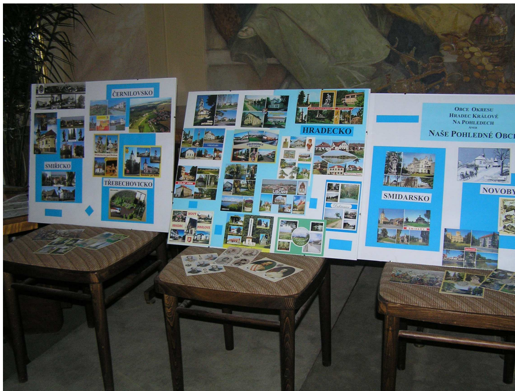
Expozice Pohlednice našich obcí aneb Naše pohledné obce v sále Knihovny města Hradce Králové

Knihovníkům okresu byly určeny odborné exkurze do Rychnova nad Kněžnou (2.6.) a na výstavu Codex Gigas v Národní knihovně (12.11., 19.11. a 26.11.). Uspořádali jsme putovní výstavu Pohlednice našich obcí aneb Naše pohledné obce , obecním knihovnám jsme nabídli elektronické publikace s turistickou tematikou v akci Cestujeme s CD-ROMy a doplnění fondů v rámci knižního bazaru. Proběhlo sedm porad vedoucích střediskových knihoven; svolali jsme aktiv knihovníků okresu Hradec Králové (18.4.).