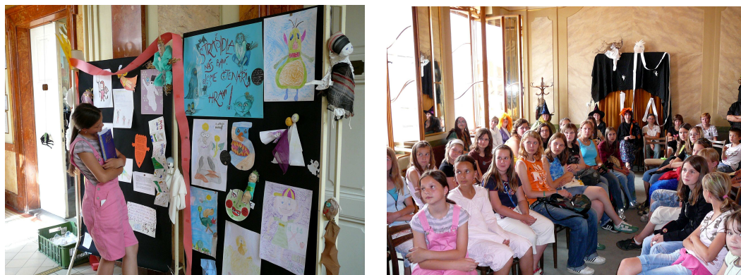
Vyhodnocení výsledků soutěže Strašidla nás baví, jsme čtenáři hraví