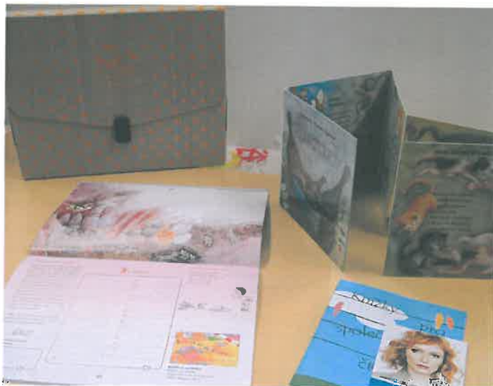
Obr. – stávající set, ukázka kufříku pro set 0-3 roky, kufřík – položka jiného dodavatele