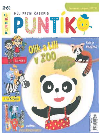
Obr. – časopis Puntík, pro set 3-6 let, položka jiného dodavatele