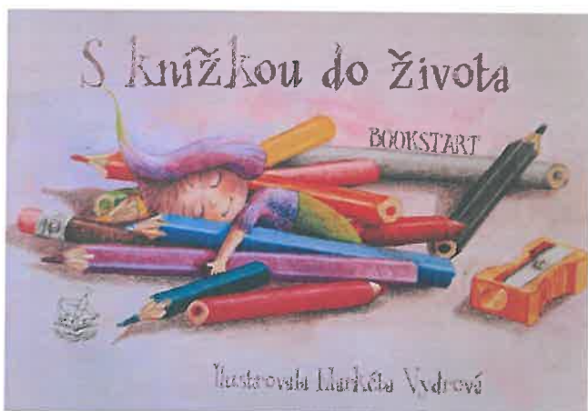
Obr. – titulní strana kalendáře A4 na ležato pro set 0-3 roky, k tisku