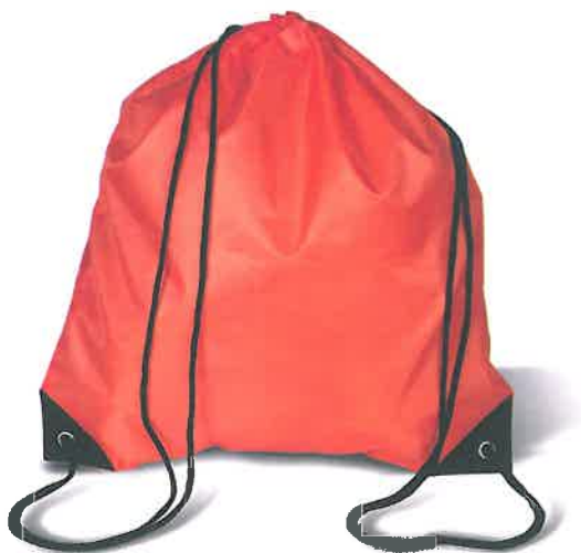
Obr. – vak na záda, pro set 3-6 let, položka jiného dodavatele