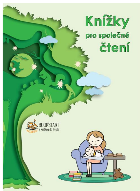
Obr. – obálka brožurky A5 pro set 0-3 roky, k tisku