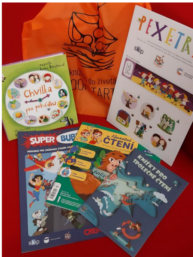
Obr. – set 3-6 let, kniha, pexetrio k tisku, obálka s kartami A6 - ALBI, Super bubliny - CREW, vak na záda, seznam literatury A5 - Knížky pro společné čtení – položky jiného dodavatele