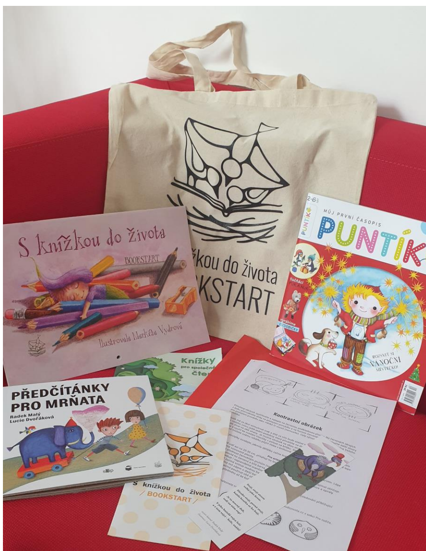
Obr. – set pro nejmenší – leporelo, kalendář, brožurka, šablona k tisku; leták DL , časopis Puntík , záložka, taška - položka jiného dodavatele