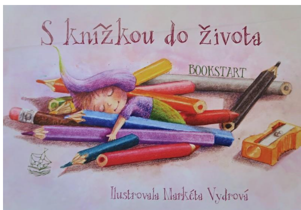
Obr. – titulní strana kalendáře A4 na ležato pro set 0-3 roky, k tisku